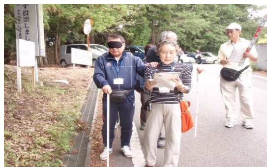
写真は、バリアフリー推進のため、白杖や車イスを用いた「まち歩き」体験