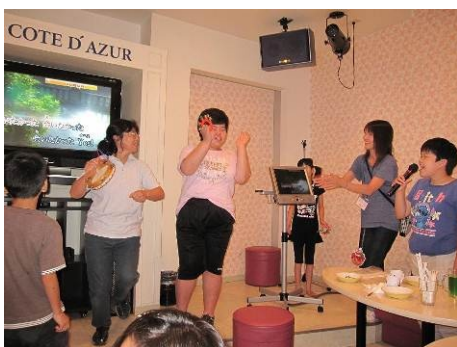
カラオケで大盛り上がり