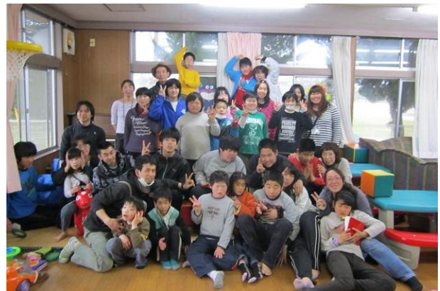
「卒業を祝う会」にて