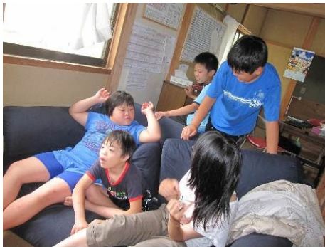
室内でまったりタイム