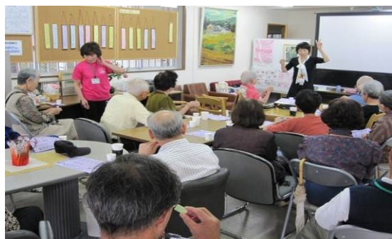
写真は、地域福祉活動拠点での歯科衛生健康教室

市内各地の小域福祉ネットワークでは、高齢者への見守りや、高齢者と児童との世代間交流、健康教室の開催といった福祉的な活動に加え、地域内パトロールや通学路見守りといった防犯活動、避難路確認などの防災活動、地域交通問題の協議、小中学校と地域との連携など、様々な取組みが進められています。