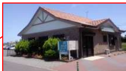
JR 成東駅徒歩13分／さんむ医療センター隣