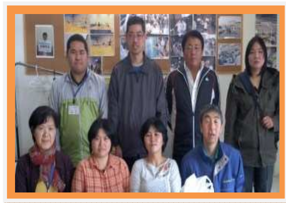
取材当日にいらっしゃったリーブのみなさん

リーブのモットーは、地域生活の主役は利用者一人ひとり。 それを職員は黒子のように支える。その中で、職員も楽しむ！