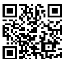
ホームページのQRコード

URL : https://kodomofestatokatsu.wixsite.com/mysite