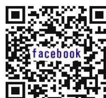
フェイスブックのQRコード