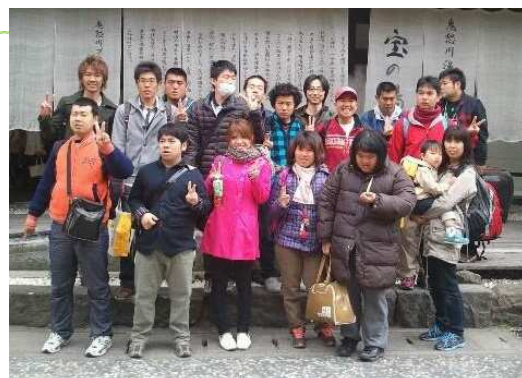
「ぶろっさむ」の一泊温泉旅行にて。